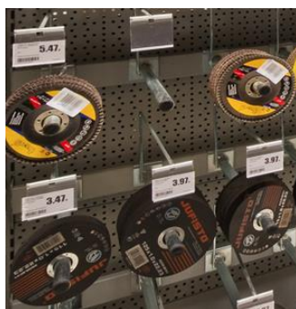
Wieszaki na belkę z uchwytem cenowym

Wieszaki na belkę z uchwytem cenowym pozwalają eksponować większe artykuły: