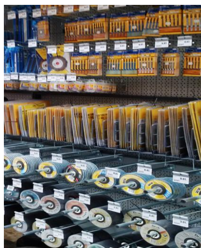
Tarcze i artykuły ściernie na wieszakach

Możemy zaproponować dowolną inną konfigurację regałów w zależności od wielkości i wysokości sklepu oraz rodzaju oferowanych produktów.