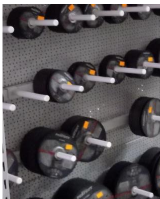
Wieszaki na belkę

Wieszaki na belkę pozwalają eksponować mniejsze artykuły: