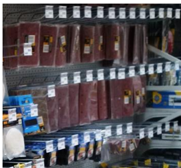
Wieszaki pojedyncze na tył perforowany z uchwytem cenowym

Wieszaki pojedyncze na tył perforowany z uchwytem cenowym pozwalają eksponować małe i lekkie artykuły: