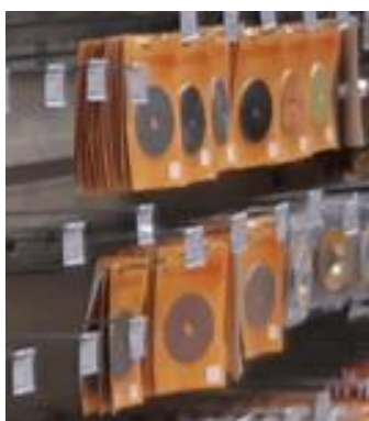
Wieszaki pojedyncze na belkę z uchwytem cenowym

Wieszaki pojedyncze na belkę z uchwytem cenowym pozwalają eksponować lekkie, ale większe artykuły: