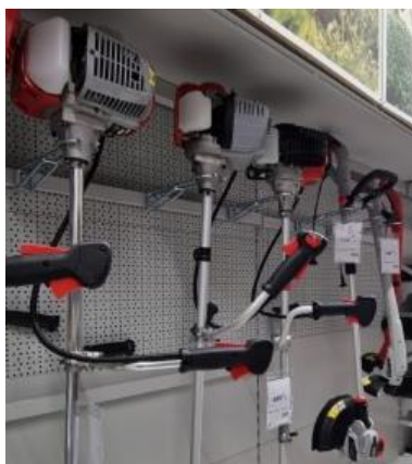
Wieszaki na belkę

Wieszaki na belkę pozwalają eksponować ciężkie i długie elektronarzędzia ogrodnicze: