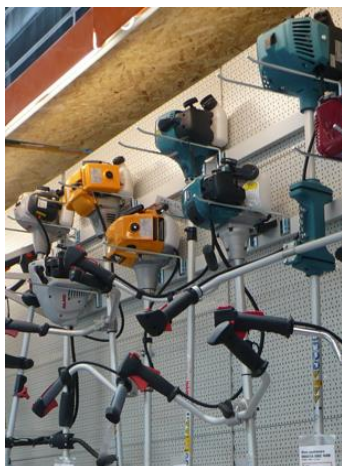
Wieszaki pojedyncze na belkę

Wieszaki pojedyncze na belkę pozwalają eksponować lekkie i krótkie elektronarzędzia ogrodnicze: