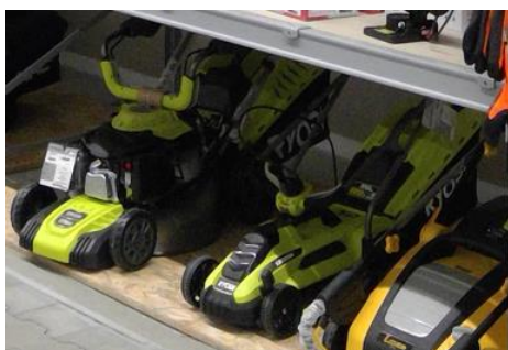
Podesty na kosiarki

Podesty na kosiarki pozwalają eksponować ciężkie i duże elektronarzędzia ogrodnicze: