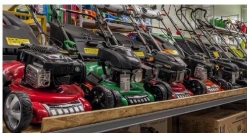
Półki na kosiarki

Półki na kosiarki pozwalają eksponować ciężkie i duże elektronarzędzia ogrodnicze: