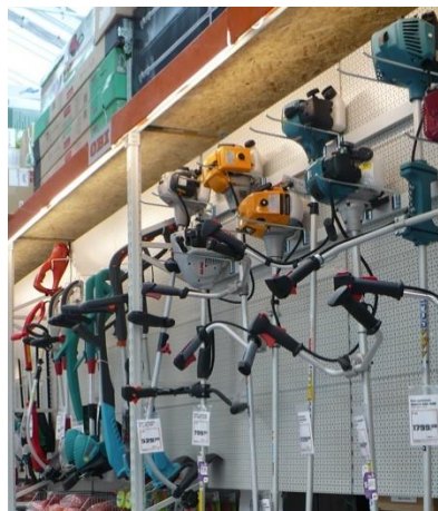
Elektronarzędzia ogrodnicze na wieszakach

Możemy zaproponować dowolną inną konfigurację regałów w zależności od wielkości i wysokości sklepu oraz rodzaju oferowanych produktów.