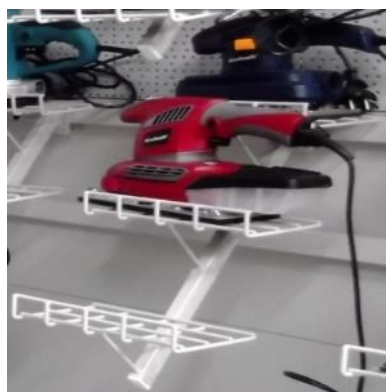
Wieszaki półkowe na belkę

Wieszaki półkowe na belkę pozwalają eksponować ciężkie elektronarzędzia, gdyż posiadają wzmocnioną budowę: