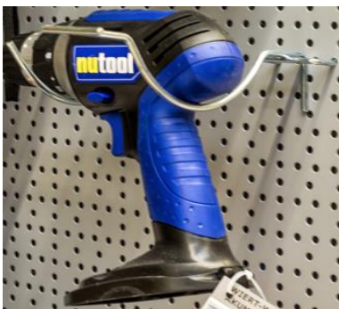
Wieszaki łukowe na tyły perforowane

Wieszaki łukowe na tyły perforowane pozwalają eksponować lekkie elektronarzędzia jak: