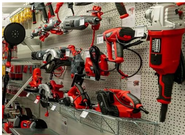
Elektronarzędzia na wieszakach i półkach

Możemy zaproponować dowolną inną konfigurację regałów w zależności od wielkości i wysokości sklepu oraz rodzaju oferowanych produktów.