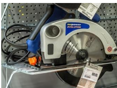
Wieszaki półkowe na tyły perforowane

Wieszaki półkowe na tyły perforowane pozwalają eksponować lekkie elektronarzędzia z tarczami tnącymi: