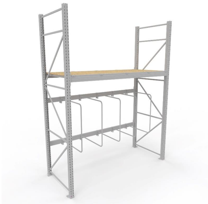
Przykładowy regał na drzwi

Dedykowane regały budowlane na drzwi pozwalają na łatwe i estetyczne prezentowanie dowolnego rodzaju drzwi: zewnętrznych oraz wewnętrznych