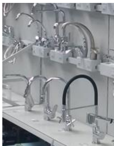
Artykuły łazienkowe i kuchenne na wieszakach i półkach

Możemy zaproponować dowolną inną konfigurację regałów w zależności od wielkości i wysokości sklepu oraz rodzaju oferowanych produktów.