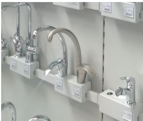
Wieszaki na belkę – prezentacja w górę

Wieszaki na belkę pozwalają eksponować artykuły do umywalek i zlewów: