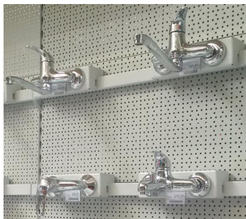
Wieszaki na belkę – prezentacja w bok

Wieszaki na belkę pozwalają eksponować artykuły do umywalek i zlewów: