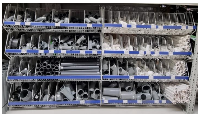
Kosze nastawne z przegrodami

Kosze nastawne z przegrodami pozwalają eksponować lekkie i krótkie akcesoria hydrauliczne, gdyż posiadają wiele podziałek: