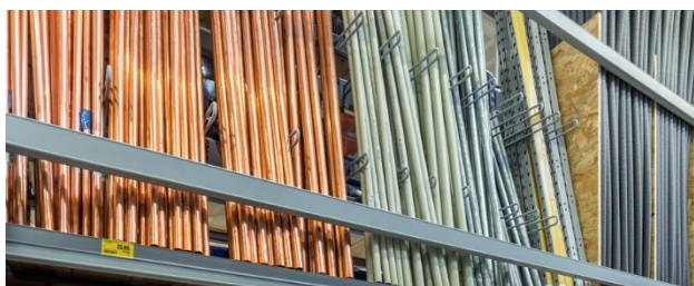
Separatory na trawers

Separatory na trawers pozwalają eksponować ciężkie i długie akcesoria hydrauliczne: