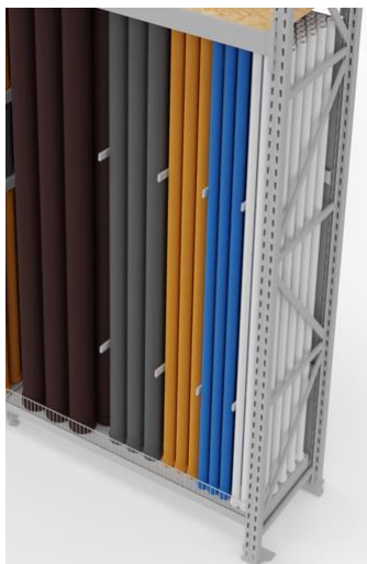
Separatory na belkę

Separatory na belkę pozwalają eksponować lekkie, ale długie akcesoria hydrauliczne jak: