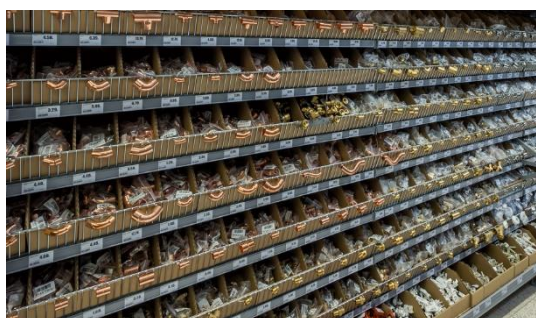
Półki z listwami frontowymi

Półki z listwami frontowymi pozwalają eksponować drobne akcesoria hydrauliczne przechowywane w kuwetach lub kartonach: