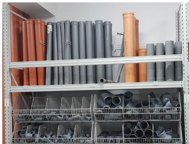
Akcesoria hydrauliczne w separatorach i koszach

Możemy zaproponować dowolną inną konfigurację regałów w zależności od wielkości i wysokości sklepu oraz rodzaju oferowanych produktów.