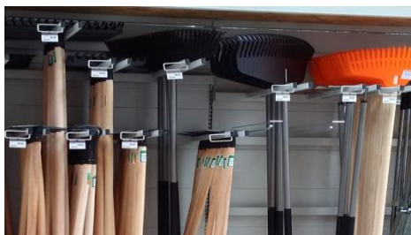
Belki z etykietą cenową

Belki z etykietą cenową na tyły perforowane pozwalają eksponować narzędzia takie jak: