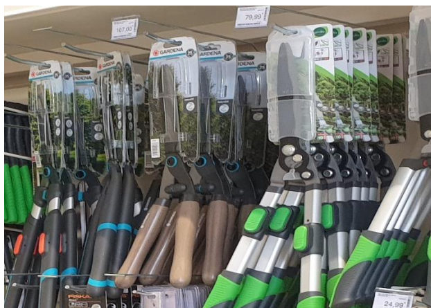
Nożyce ręczne zamocowane za pomocą wieszaków na perforacji

Możemy zaproponować dowolną inną konfigurację regałów w zależności od wielkości i wysokości sklepu oraz rodzaju oferowanych produktów.